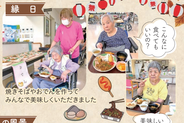
焼きそばやおでんを作ってみんなで美味しくいただきました