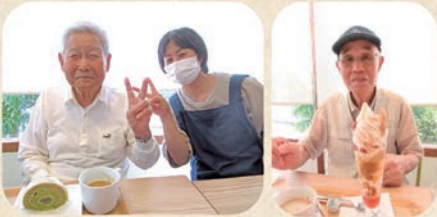
好きなスイーツを選びました