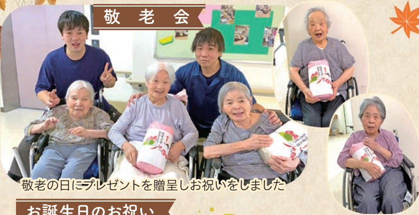
敬老の日にプレゼントを贈呈しお祝いをしました