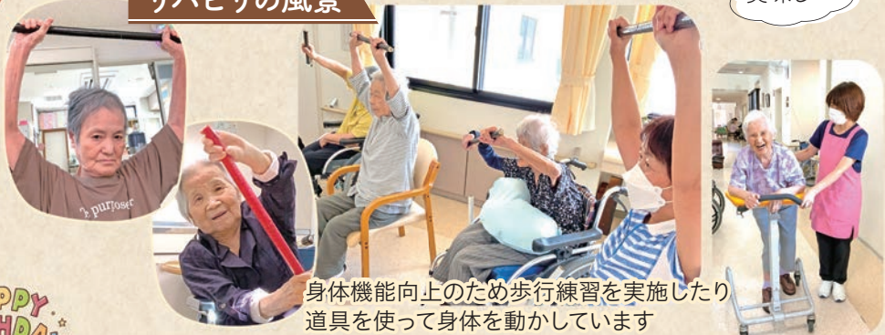
身体機能向上のため歩行練習を実施したり道具を使って身体を動かしています

利用者様の笑顔が増えるよう行事やレクリエーションを実施し、楽しく過ごせる環境作りに努めています。