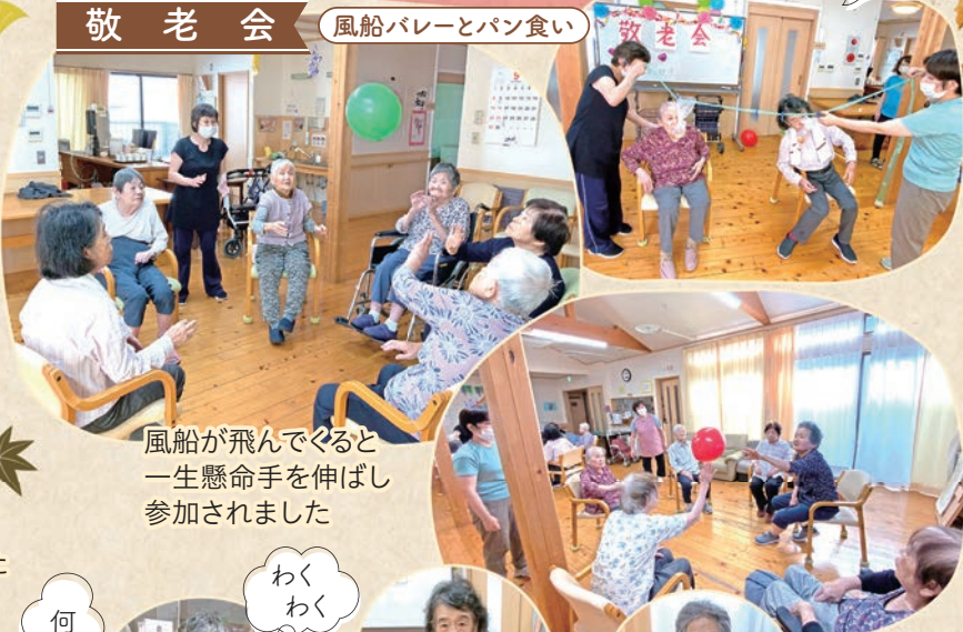
風船が飛んでくると一生懸命手を伸ばし参加されました