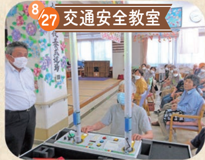
反射神経テストに挑戦!