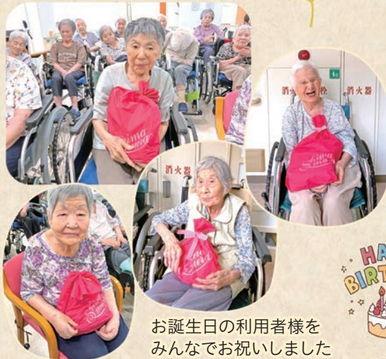
お誕生日の利用者様をみんなで祝いしました