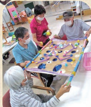
ボール転がしゲーム