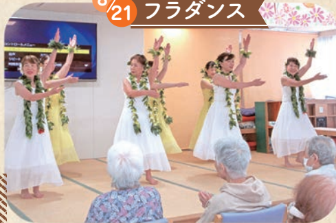
みきシスターズ様、素敵なダンスでした