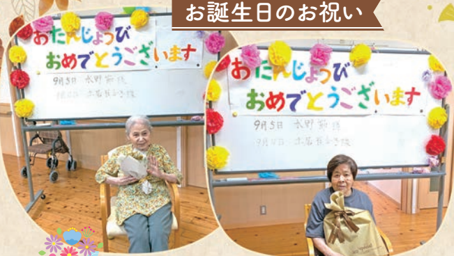
来年も一緒にお祝いしましょう！