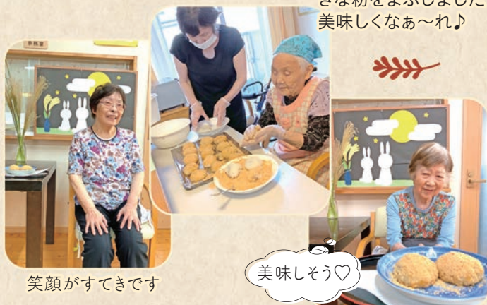
笑顔がすてきです