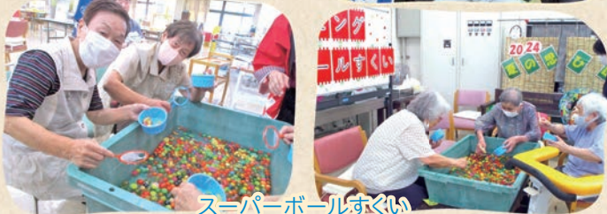
スーパーボールすくい